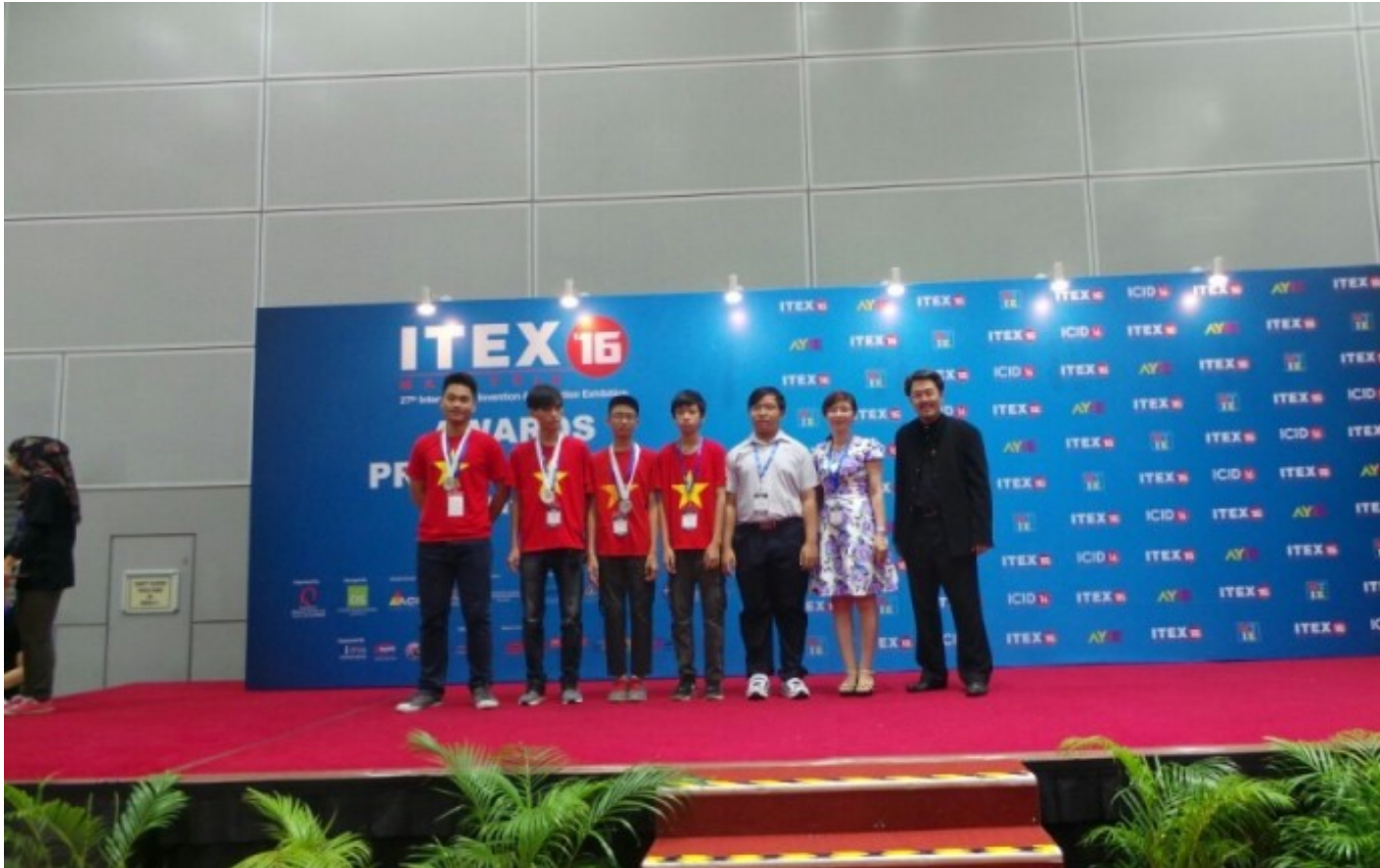
◻ Học sinh đoạt Huy chương Bạc