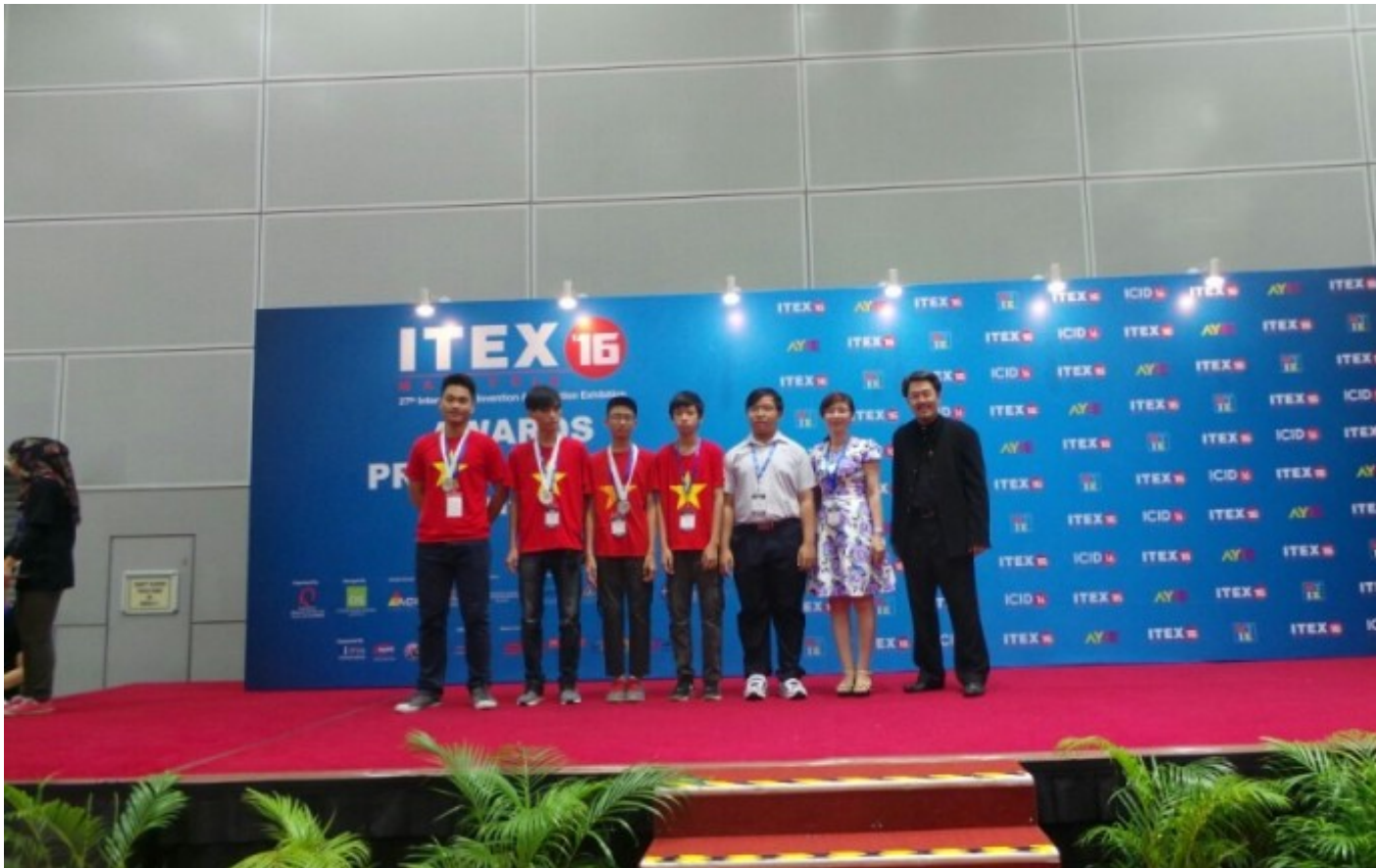
◻ Học sinh đoạt Huy chương Bạc